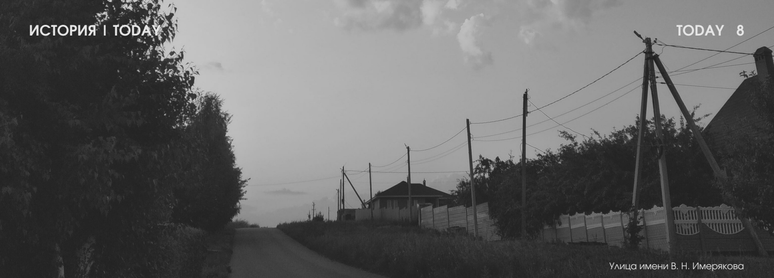
Улица имени В. Н. Имерякова